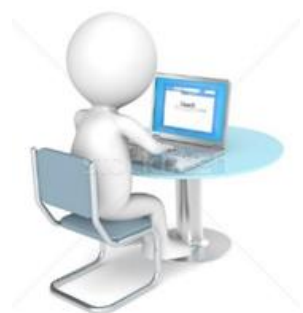
ГРАФИК ПРОХОЖДЕНИЯ АТТЕСТАЦИИ ПЕДАГОГИЧЕСКИМИ РАБОТНИКАМИ